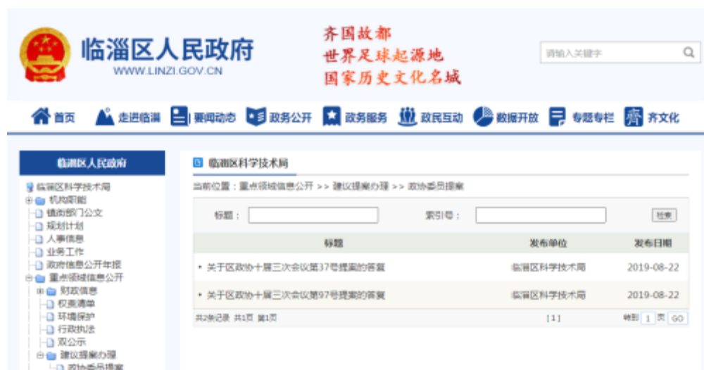
人大代表建议政协委员提案信息截图

高度重视人大政协提案，分管领导牵头，指派专人负责具体办理工作，确保提案的按时办理和答复。2019 年共收到建议委员提案办理 2 条。