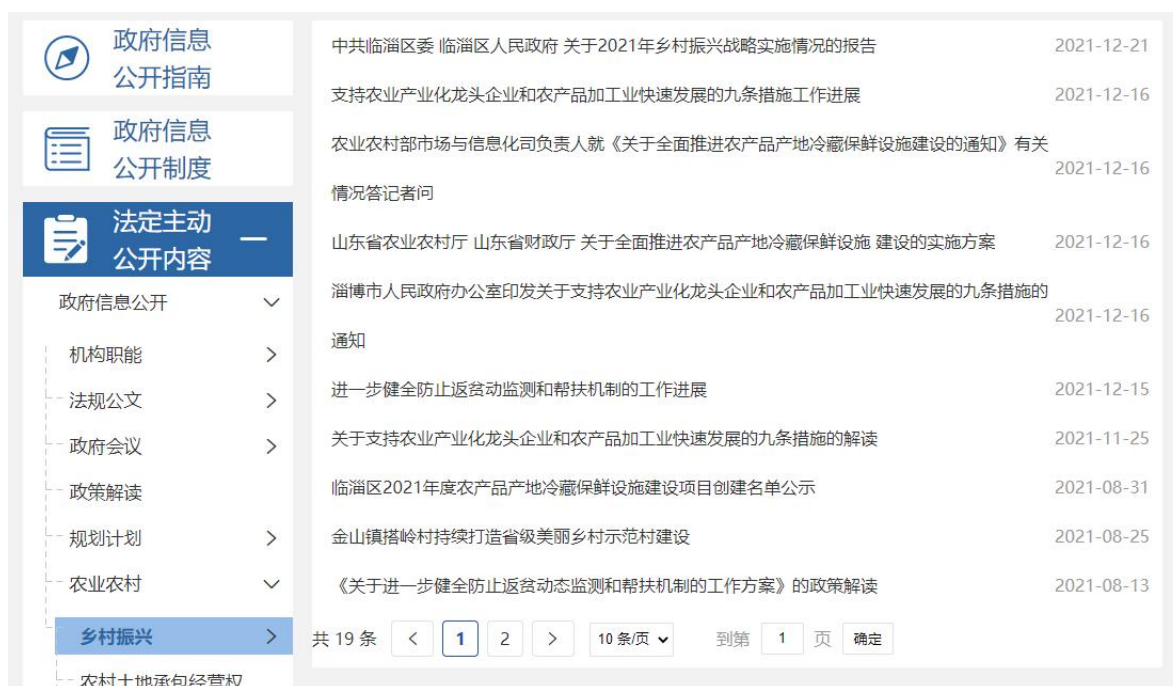
图 3：乡村振兴信息截图