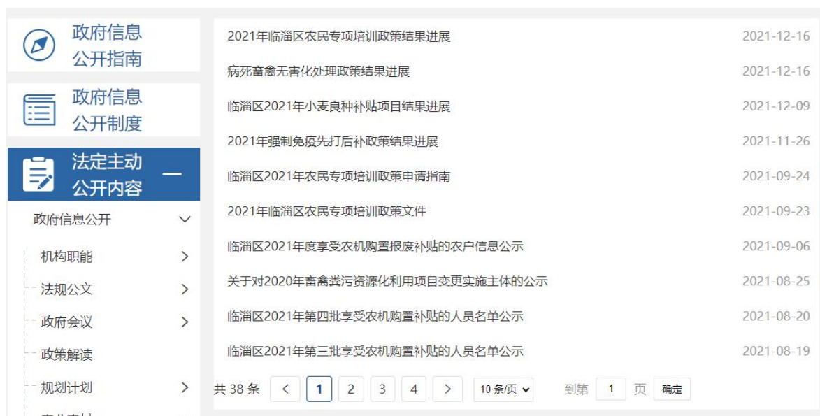
图 4：涉农补贴信息截图