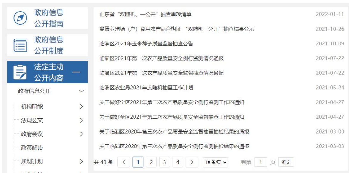
图 2：双随机一公开信息截图