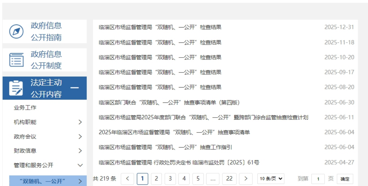
图 5. “双随机、一公开”监管信息截图