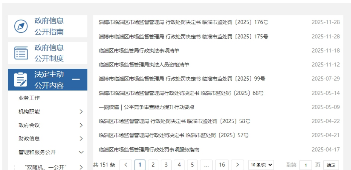
图 6. 行政执法信息截图