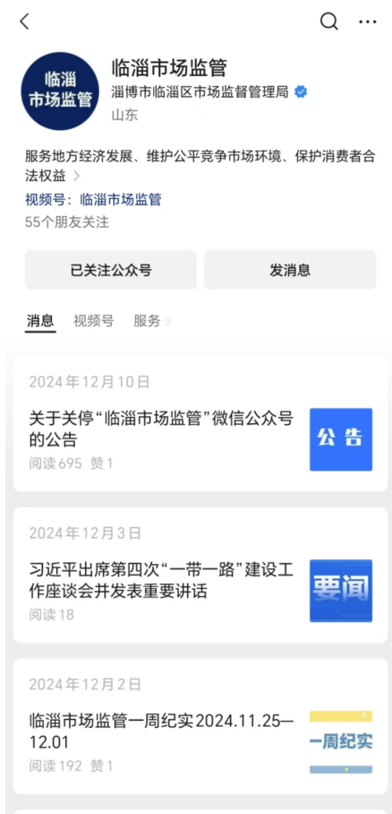
图 7. 微信公众号信息截图

专场活动情况、知识产权“大调研、送服务”赋能专精特新企业创新发展经验做法等进行深入报道和及时推送，推动产业结构优化升级、战略新兴产业创新发展。2024年，区局共制作公众号信息369篇。