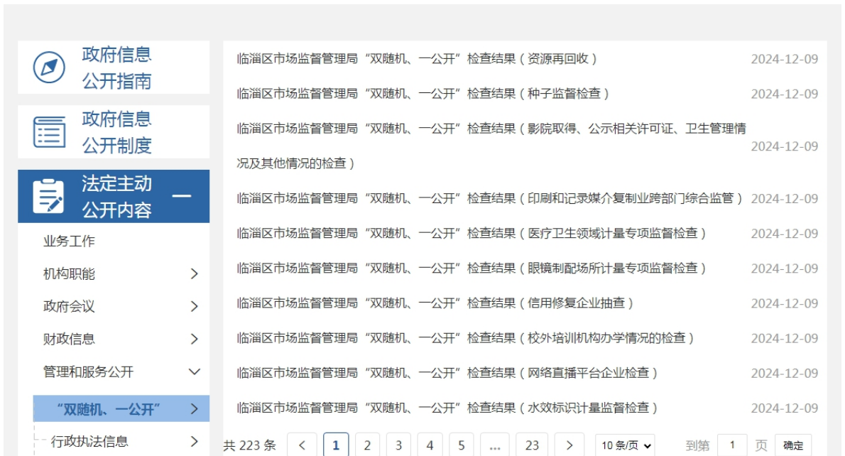
图 5. “双随机、一公开”监管信息截图