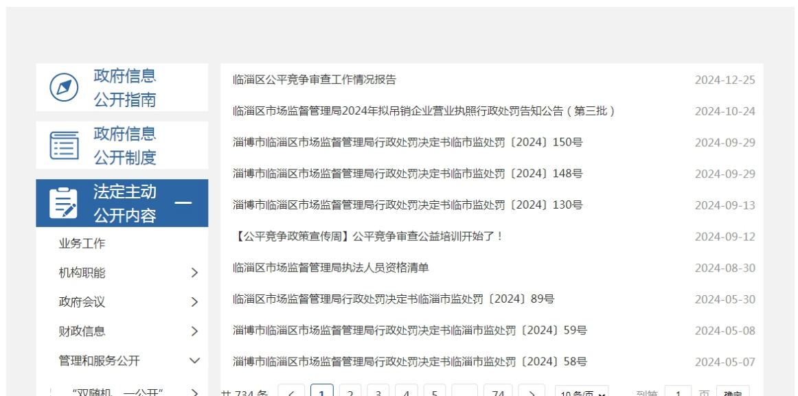
图 6. 行政执法信息截图

（二）依申请公开工作方面。2024年，我局收到政府信息公开申请 21 件，同比增长 425%，全部依法依规予以办理。其中，