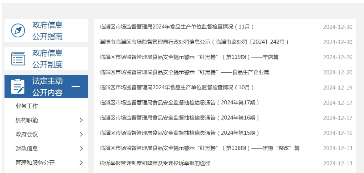
图 3. 食品药品安全信息截图