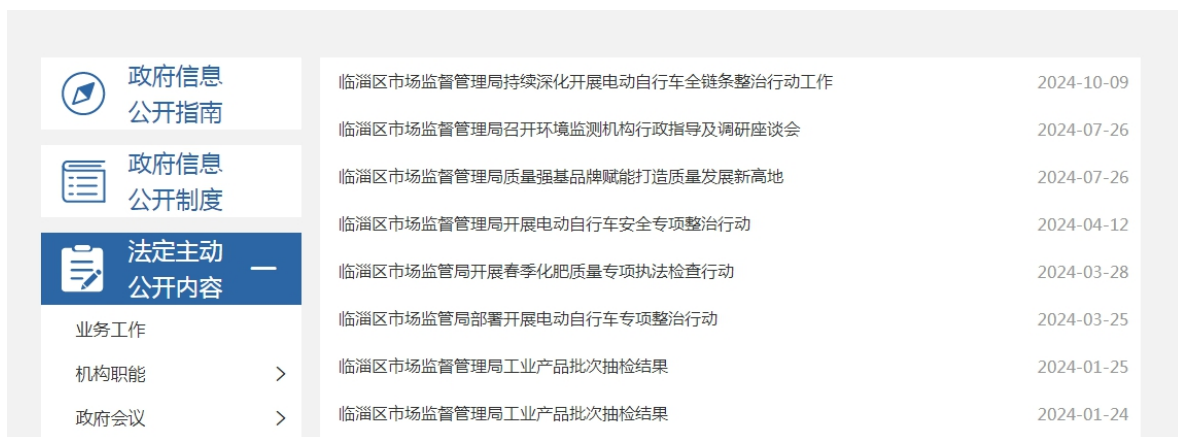
图 4. 产品质量监管信息截图