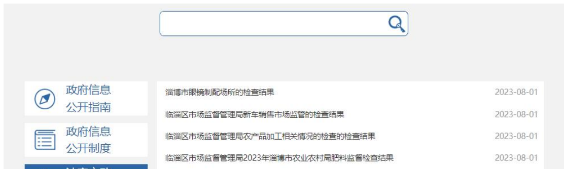
图 4. 产品质量监管信息截图