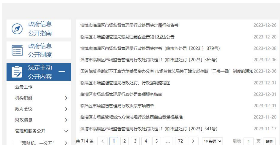
图 6. 行政执法信息截图

（二）依申请公开工作情况。2023 年，我局收到政府信息公开申请 4 件，同比增长 33.3%，全部依法依规予以办理。其中，通过邮件等方式收到自然人关于本单位政府信息公开申请 1 件，