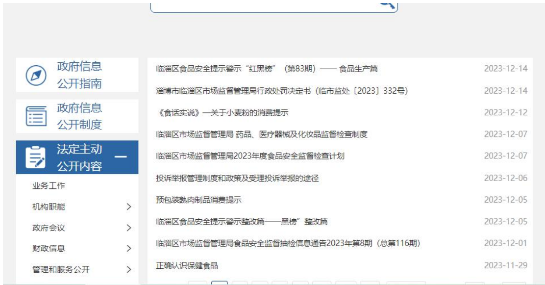
图 3. 食品药品安全信息截图