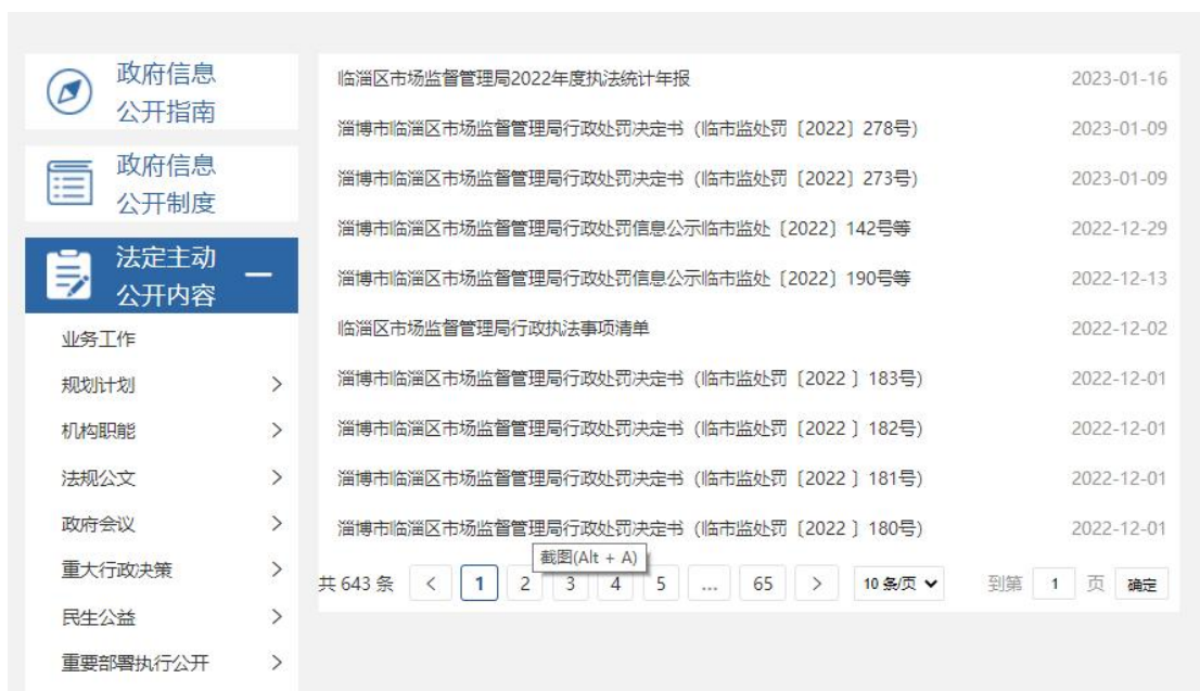
图 6. 行政执法信息截图

(二) 2022 年依申请公开情况。2022 年我局收到依申请公开 3 件，其中，通过邮件等方式收到自然人关于本单位政府信息公开申请 2 件，通过政府平台收到自然人关于本单位政府信息公开申请 1 件。其中，本机关已主动公开 1 件，不掌握相关政府信息 1 件，相关证据材料属行政执法案卷信息不予公开 1 件，办结率 100%。