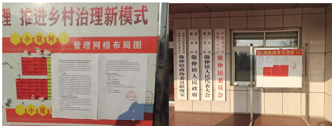
图3-3 周边村庄现场张贴公示