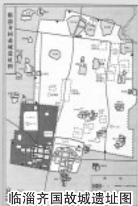
临淄齐国故城遗址图

“因其俗,简其礼”的治齐原则;“与时变,与俗化”的变革观念;“尊贤智,赏有功”的用人方针;尚礼义,重法制的政治传统;“均田分力”,“相地哀征”的农业制度;“通商工之业,便鱼盐之利”的工商政策;“来天下之人,聚天下之财”的开放措施;孟津观兵,牧野之战的兵权奇计;“尊王攘夷”“不战而屈人之兵”的称霸方略;围魏救赵,减灶诱敌的取胜战术;“不辱小节,耻功名不立”的人生追求;“社稷是主”,不死君难的价值取向;有道则仕,无道则隐的