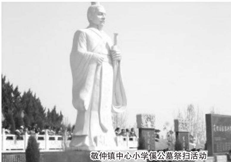
敬仲镇中心小学傒公墓祭扫活动

区委区政府号召,在努力完成国家课程之余,高度重视了对齐文化校本课程的教育工作。连续两年来每逢清明之际,校领导都会积极组织師生们来到齐文化教育基地——齐上卿高傒墓陵进行祭扫游园活动。特别提及的是,在习总书记“弘扬中国传统文化、增强文化软实力、建设社会主义核心价值观体系”讲话精神的激励与鼓舞下,師生们从根本上对齐文化有了一定的认识。笔者在与師生们的交谈中意识到,广大青少年不单单只是对齐文化知识有兴趣,而且他们也在不同程度的用心钻研齐文化更深层次的知识内涵。■