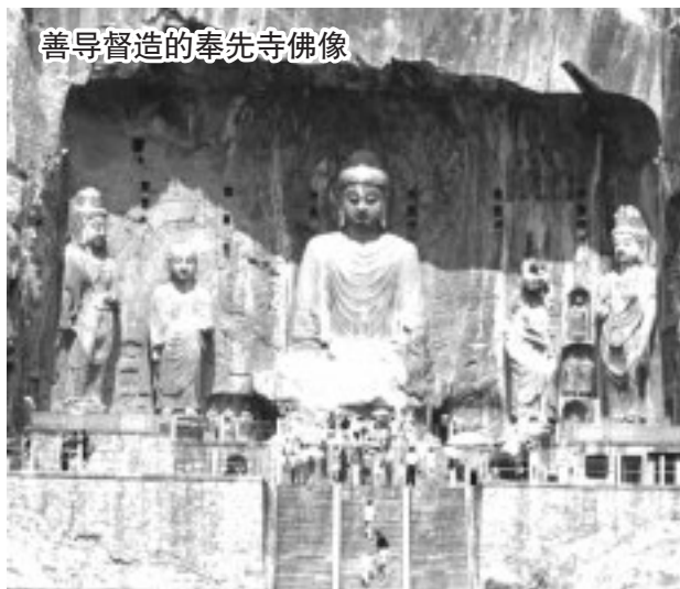
善导督造的奉先寺佛像

大师处世为人师表，上受帝王之尊崇，下为世人所敬仰。据《佛祖统纪·卷廿六·净土立教志》记言：宋代时宗晓，择取宋前不同年代修持得力，盛弘净土法门的高僧大德共7人，立为莲宗七祖，将大师列于庐山慧远大师之次，列为莲宗二祖。而净土教法传到日本后，日本净宗更尊称大师为“高祖”“宗家”等。并有奉阿弥陀佛为初祖，善导为二祖，法然上人（日僧）为三祖的说法，诚乃推崇之至。然若了知善导大师之生平事迹者，皆谓名至实归。大师在长安弘化的那些年，被他影响教化的人不知道有多少。据《往生传》里面讲：“士女奉者，其数无量。”信奉他的人，男男女女，“其数无量”，度化的人已经没有办法计算了。在另一部《往生西方略传》中，则有记载说：“三年之后，长安城中就已经被念佛的人给充满了。”大家要晓得，我们大唐王朝的这个都城长安（现在的西安），那绝对是当时的世界第一大城，所谓“物华天宝，人杰地灵”，这就是形容长安的。中国佛协与日本净土宗，曾召集两国佛教徒及学者于1998年5月，在长安香积寺举行了盛大的纪念法会，以纪念