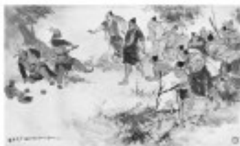
陈胜吴广 大泽乡起义