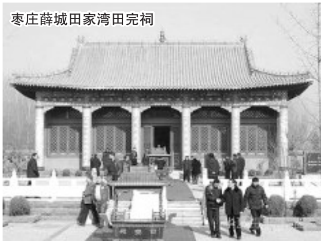
枣庄薛城田家湾田完祠

(天子)身边的重要人物。但是,不在本国,而是在外国;也不在他这一辈子,而是在他的子孙后代。因为大风刮起后,最终还是要落在土上,即使刮出了国境,还是要落在外国的土地上,“风行而著于土”,所以最终的应验,将会是在外国。《观》卦巽在上坤在下。巽为大风,主东南,巽风向东南方刮起后,最终落在了“坤”土上。坤属土。而齐国姓姜,正是四岳的后人,岳即是山即是土。所以应该到齐国才可以使本国光大。因为曾经算过这样一次占卜,所以后