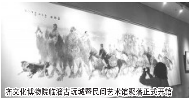
齐文化博物院临淄古玩城暨民间艺术馆聚落正式开馆

大顺文化艺术馆带给我的是更多的震撼。大顺集团聘请国内具备专业实力的展馆设计专家科学规划展陈,由陶瓷文化展厅、铜器文化展厅、古钱币银器文化展厅、床文化展厅、牌匾文化展厅、屏风文化展厅和学术交流厅等14个厅23个区组成。铜器文