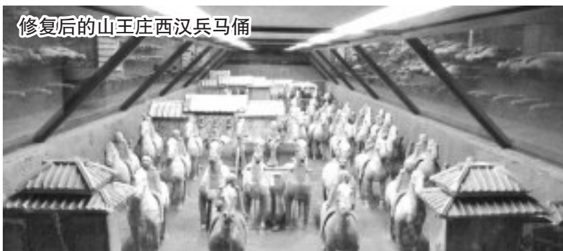
修复后的山王庄西汉兵马俑

文物提取以后,国家、省、市文物部门对此给予高度重视和大力配合,2011年,临淄齐国故城遗址博物馆与陕西秦俑博物馆合作,启动了临淄山王庄西汉兵马俑彩绘陶器修复项目。历经三年的修复工作,500余件套彩绘兵马俑已全部修复完毕并完成复原布展,到2013年5月18日,齐国故城遗址博物馆“山王庄西汉兵马俑”展厅正式对外开放展览,吸引国内外无数游客前来观看,对当时规模如此宏大的出行场景赞叹不已。📷