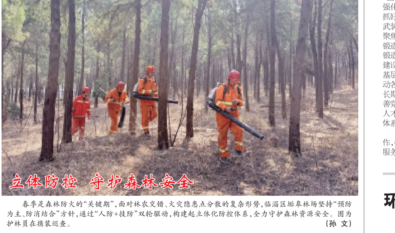
春季是森林防火的“关键期”,面对林农交错、火灾隐患分散的复杂形势,临淄区筑牢森林防护“防火墙”,通过“人防+技防”双轮驱动,构建起立体化防控体系,全力守护森林资源安全。图为护林员在检查巡查。

本报讯 4月2日,全区组织工作暨老干部工作会议召开。会议深入学习贯彻习近平总书记关于党的建设的重要思想和关于党的自我革命的重要思想,认真落实上级组织工作部署安排,总结2025年工作,部署2026年重点工作。区委书记蔡华刚出席会议并讲话,区委常委、组织部部长刘晓明等参加。