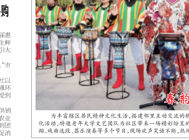
为丰富辖区居民精神文化生活,搭建邻里互动交流的桥梁,近日,雪宫街道办事处开展春季户外文化活动,特邀老年大学艺术团为社区带来一场精彩纷呈的互动演出。