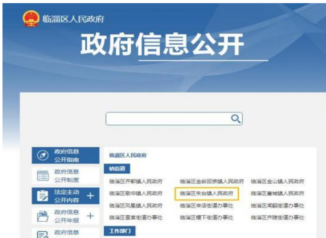
朱台镇政府信息公开主阵地

5.监督保障情况：一是按照市区政务公开办的统一部署安排，积极参加区政务公开办组织的各项工作培训，及时掌握县政务公开工作动态，根据主动公开目录，及时调整、完善相关栏目及内容。坚持内部监督和社会监督相结合体系，对外公布投诉举报电话，推进人民群众监督和舆论监督。二是加强组织领导，2022年根据人事变动，调整了工作领导小组，明确以主要领导为组长、分管领导为副组长、政务公开专职人员的工